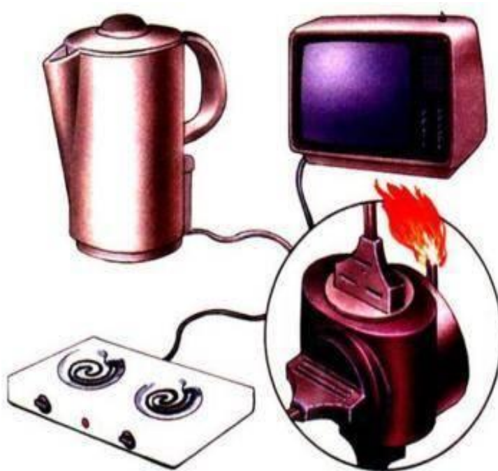
Перегрузка электропроводов

9) Помни: от твоих первых действий зависит, насколько быстро будет распространяться дым и огонь по подъезду.