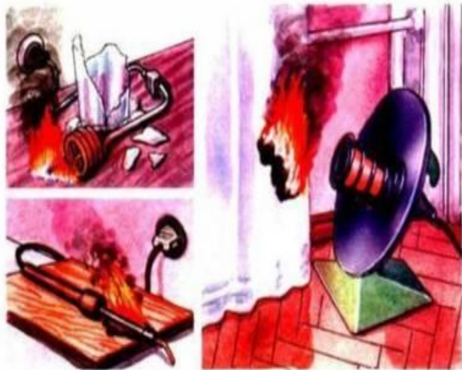
Оставление без присмотра электрических нагревателей kuhta.dan.su