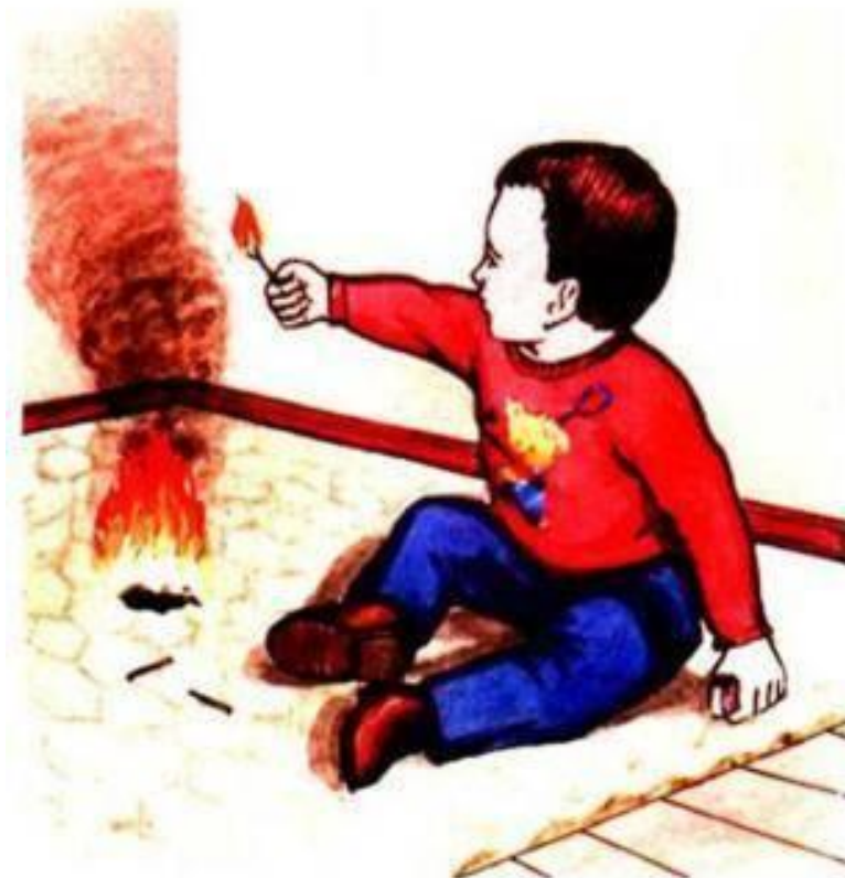
Детская шалость kuhta.dan.su

ЗНАЙ: вызов пожарной команды просто так, из шалости или любопытства, не только отвлечёт спасателей от настоящего происшествия, но и будет иметь весьма неприятные последствия. Заведомо ложный вызов пожарных (так же, как и милиции, "скорой